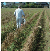
■大豆溝三面草刈作業

最大出力 4.2ps (3.0kw) 刈幅 570 mm ~670 mm 走行 前進2段 後進1段 三面 スライド