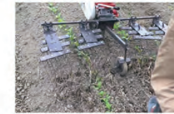
株間除草作業 (別売:株間除草セット)