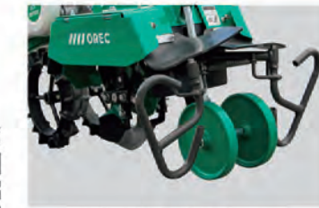
マルチぎわ除草セット (別売)