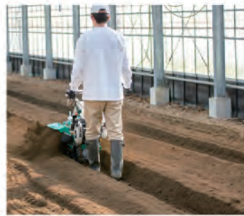
溝堀作業 (別売:溝堀ローターセット)