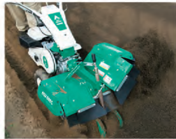
片排土作業 (別売:片排土ローターセット)