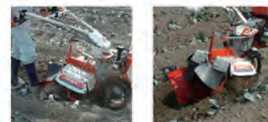
畝肩削りローターセット 畝肩整形器+尾輪UK