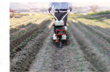
中耕培土作業 (別売:中耕ローター+ML培土板)