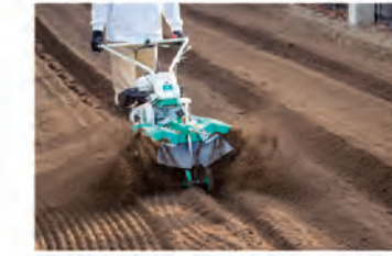
溝堀作業 (別売:溝堀ローターセット)