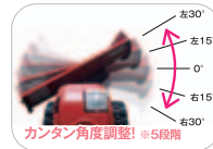
カンタン角度調整! ※5段階