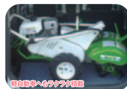
軽自動車へのラクラク積載