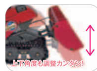
上下角度も調整カンタン!