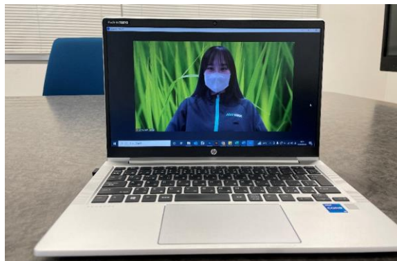
オンライン会議の背景イメージ