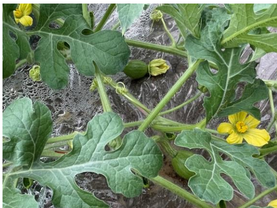
授粉後、約3~4日で着果した様子