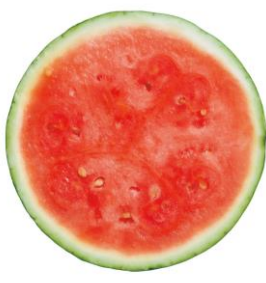
TANE FREEを授粉して 栽培されたスイカ