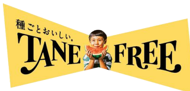
ロゴマーク/スイカラベルイメージ