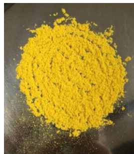
スイカ花粉 「TANE FREE」