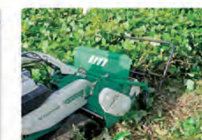
背丈の高い草やツル科の雑草も刈り易くなります。