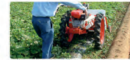
甘藷や里芋など収穫前のつる刈り作業に最適