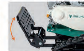
折りたたんで収納