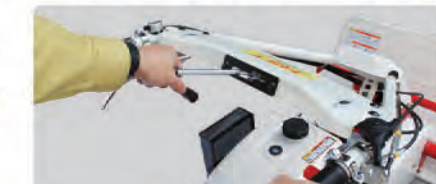
レバー1本で前後進切換え