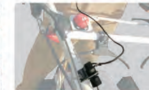
安全のため使用時は付属の緊急停止スイッチを使用して下さい。