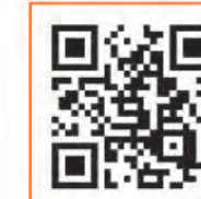
楽々ディバイダーセットの動画をチェック!!