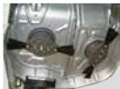
フリーナイフ仕様