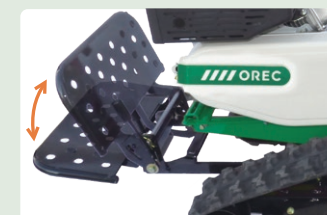
折りたたんで収納