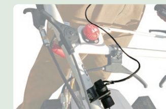
安全のため、使用時は付属の緊急停止スイッチを使用して下さい