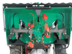
一軸正逆(黒:正転、赤:逆転)

内側の爪が逆転、外側の爪が正転、しっかり耕うん作業ができます。内側の爪が逆転の為ダッシング防止効果になります。