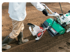
うね立て作業(別売)